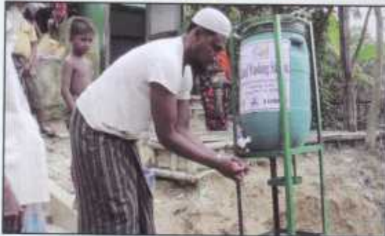
Hand wash in the Refugee Camp