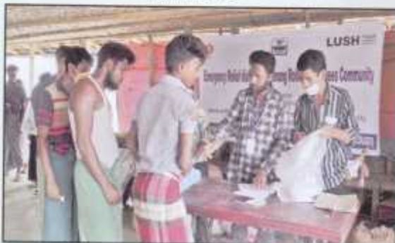
Seeds given to refugees for permaculture gardening