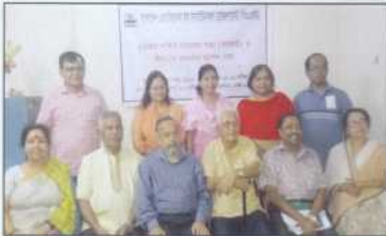
Board Members and Advisors after the 27th AGM