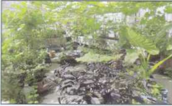
Attractive roof garden