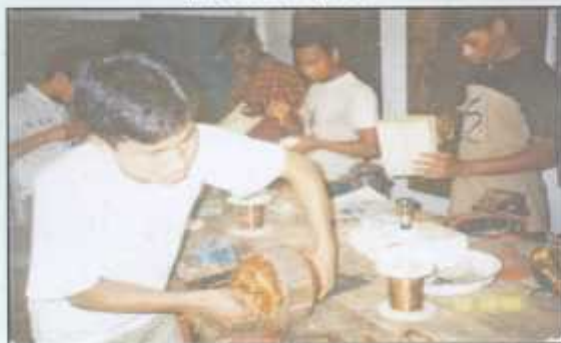
Tribal youths learning electrical works