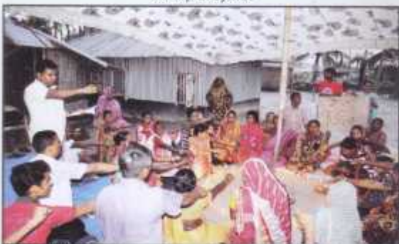
Ecovillage members gathered in evening meditation and cultural program at Mongla