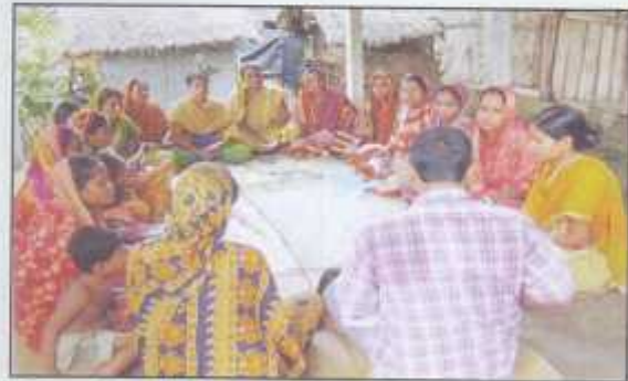
Savings Group Members are in a regular meeting at Sodasodi