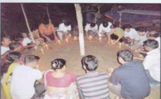
Ecovillage Trainees are in candle light prayer before starting the EDE in 2010