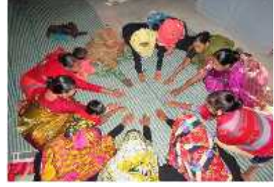
আমরা একতায় প্রতিজ্ঞ

অবশেষে, ২০২১ সালের আগস্ট মাসে লকডাউন শিথিল হয়। প্রায় ছয়-সাত মাস কাজ করার পরও দল বা মাঠ পর্যায়ে কোন কার্যক্রম সম্ভাষণজনক পর্যায়ে উন্নত করা যায়নি। একদিকে যেহেতু কোভিড সংক্রমণের ভয় পুরোপুরি কাটেনি, অন্যদিকে মানুষের বেকারত্ব উচ্চমাত্রায় বৃদ্ধি পাওয়ার ফলে মানুষের আয়-রোজগার চরম পর্যায়ে হ্রাস পায়, ফলশ্রুতিতে দারিদ্র্যতার সৃষ্টি হয়। এ সময় সদস্যদেরকে সমিতির সকল প্রকার সভা, কর্মশালা আহ্বান জানালেও তাদের নিকট থেকে ভালো সাড়া পাওয়া যায়নি। কারণ খাদ্য মাত্রায় পৌঁছেছিল যে তাদেরকে ত্রাণের জন্য এখানে সেখানে ছোটোছোটো করতে এভাবে এক এক করে কমিটির অধিকাংশ সদস্য ও সাধারণ সদস্য সমিতি থেকে সরে গিয়েছিল। শুধু তাই নয়, সঞ্চয় উত্তোলনের হার এত বেশি ছিল, যা ছিল অত্যন্ত ঝুঁকিপূর্ণ। এ সময় সমিতির কার্যক্রমের গতি ফিরিয়ে আনা ও উন্নত করার দু/একজন কমিটির সদস্য হাল ছাড়েনি। তাদের প্রাণপন চেষ্টা এবং কোভিড এর হ্রাসকরণের সংগ্রাম ও নিয়মিত প্রচেষ্টা অব্যাহত থাকলেও তারা বেশি দূর আগাতে তাই নয়, নেটওয়ার্কের কোন কোন নেতাদেরও পুনঃরায় সমিতির দায়িত্বে ফিরিয়ে আনা বা নতুন নেতৃত্ব গঠন করাও সম্ভব হয়নি কারণ অনেক সদস্য এই মুহূর্তে আর্থ-সামাজিকভাবে বিব্রতকর পরিস্থিতিতে জড়িয়ে পড়েছিল।