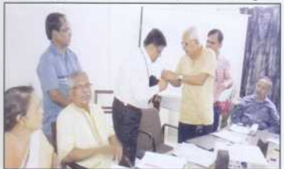
Board Members and Advisors Meeting