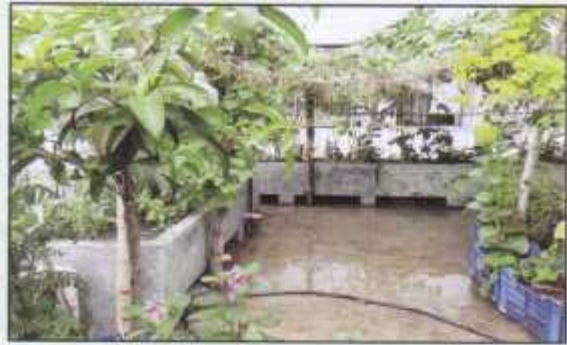
A beautiful roof top permaculture garden