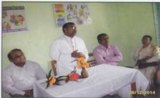
Archbishop Bijoy N. Cruze visits BASD Office while he was Bishop of Sylhet