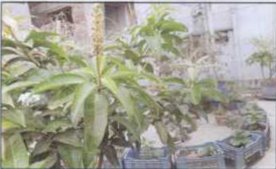
Produced through roof gardening