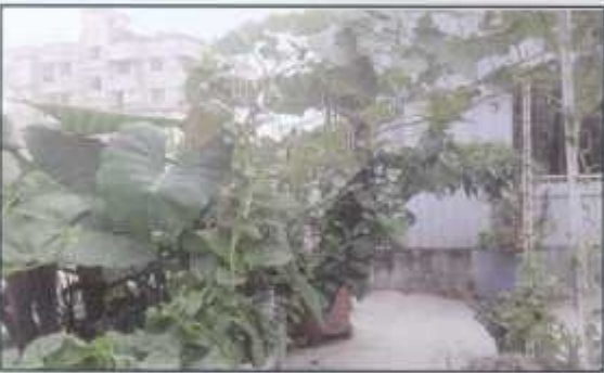
This is not a gate but gate of a Roof Garden