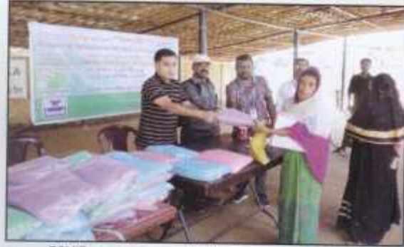
COVID prevention materials given to the refugees