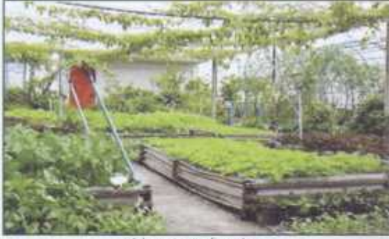
A beauty roof garden