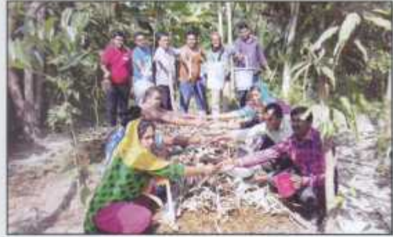
Promising towards gardening