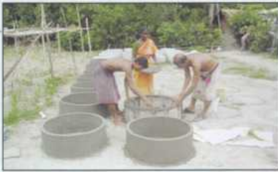
Members learning and practicing pit latrine.