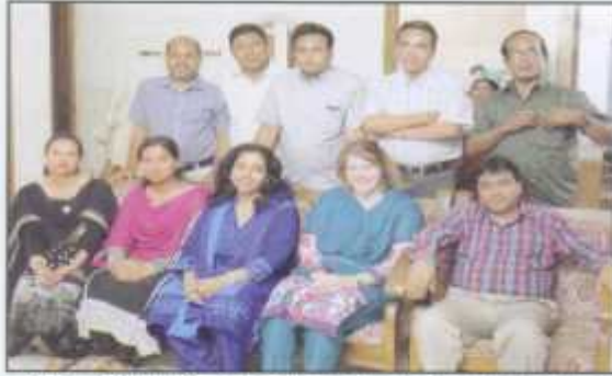
Donor, Staff and Board Members after the Capacity building Training