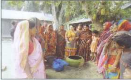
Practical session for learning liquid fertilizer