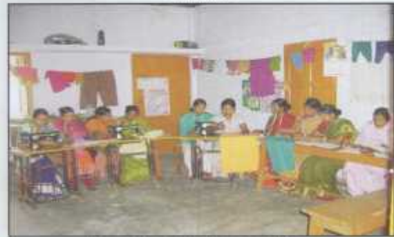
Drop out students learning tailoring.