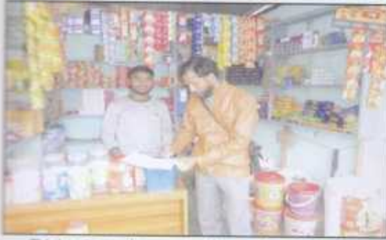
This is an exemplary grocery shop run by a Tea worker