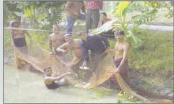
A Group of EDE Trainees are busy for fishing in free time at Banishanta