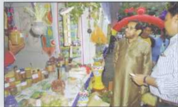
Honorable Minister is visiting a Permaculture Staff at Rajbari in