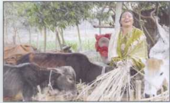
I am very proud having been self reliant rearing cows, goats and chickens