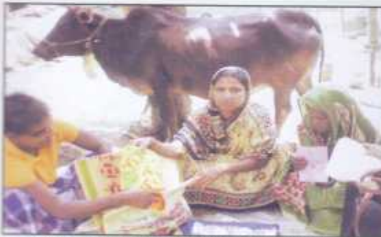
Women selling their own made hand-loom clothes at Araihaazar