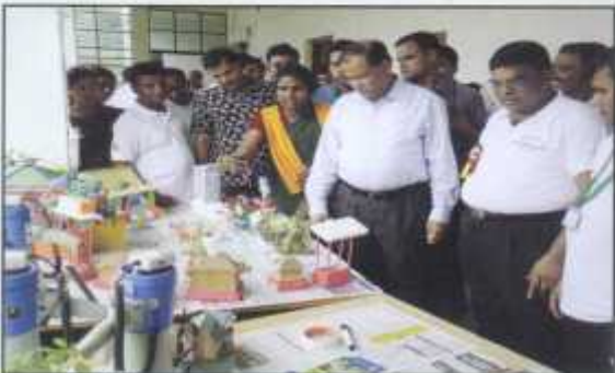
Honorable Minister, Hasan Mamud is visiting BASD's Ecovillage Demonstration Stall