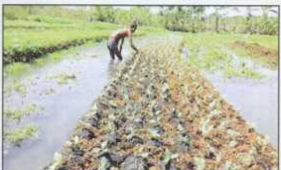
An example of floating garden in the rural area