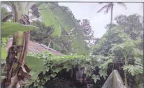
Eco-Design garden house at Banishanta