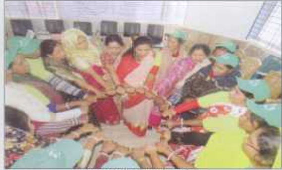
We are united, we are one