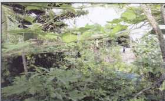
Multi-lair Eco Garden