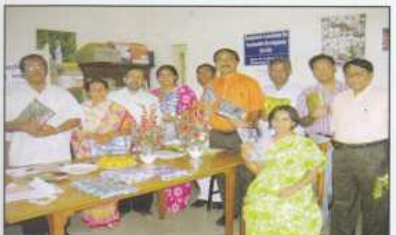
Board Members are in a Christmas Gift Exchange Program