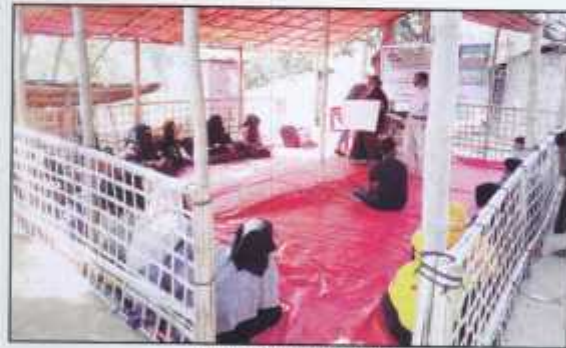
PDC training in camp