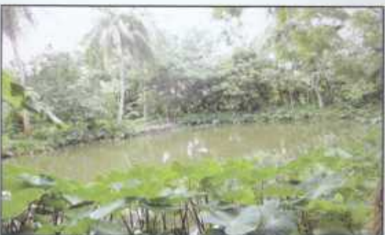
Integrated fish cultivation at Banishanta