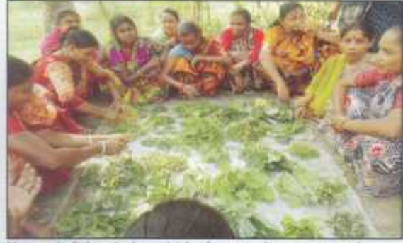
No need of chemical pesticides from market, we can make our own herbal pesticides