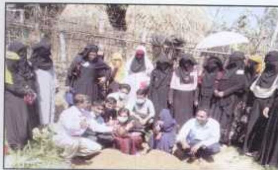
Participants after permaculture training in camp