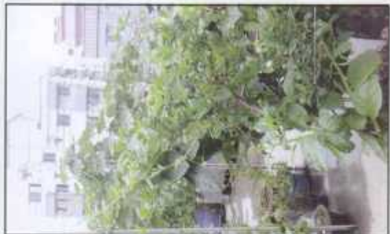
A different design of roof garden