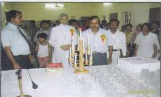
15 Year Celebration - 11-5-07, Bishop Linus and Board Members are seen