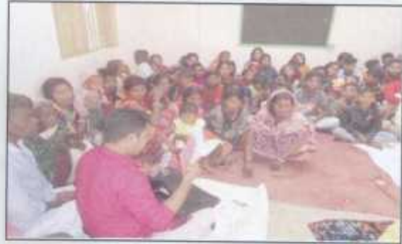
Tea worker savings members gathered in a discussion meeting.