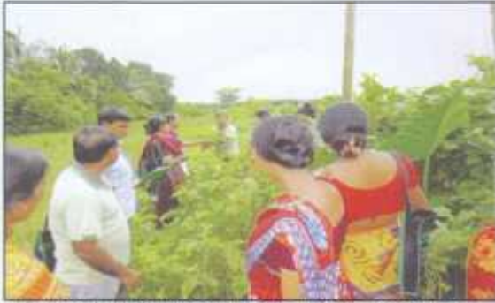
Permaculture Course participants are in practical learning session at Banishanta