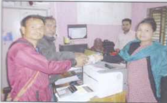
Members of Srimongal taking loan for IGP