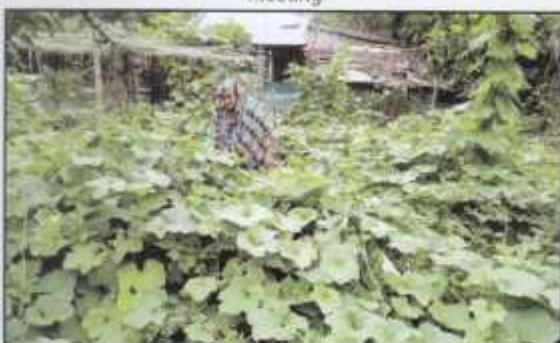
Successful Rukshana of Mongla, using 100% of her house, compound and fruitless trees