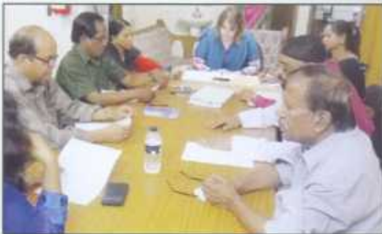
Capacity building Training for Staff, Board Members and Leaders by Tear Australia