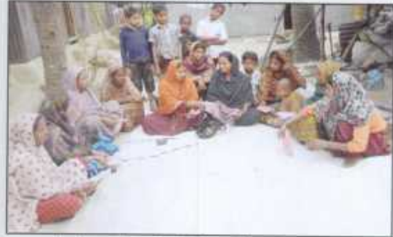
Members discussing their problems in a meeting