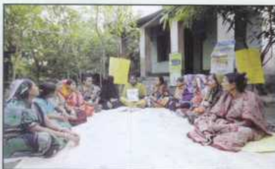
Ecovillage Members of Uttor Banishanta met in the weekly meeting